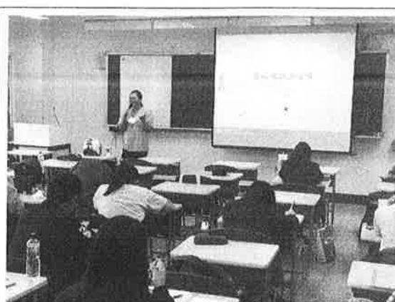
活 動 照 片 說 明