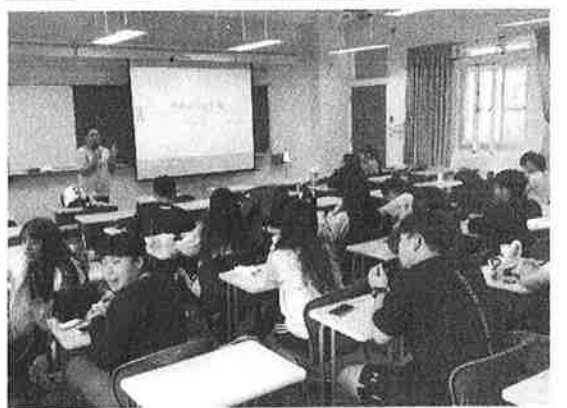
活 動 照 片 說 明