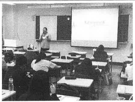
活 動 照 片 說 明