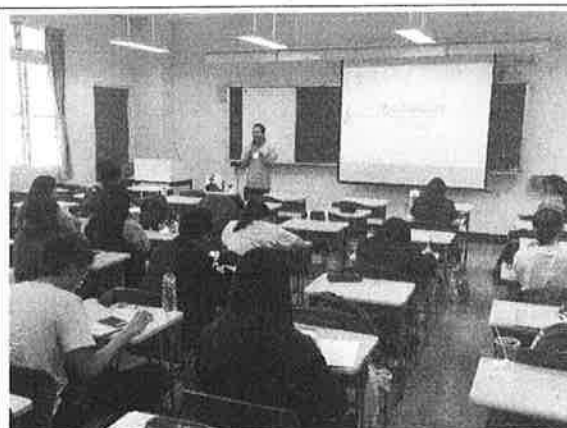
活 動 照 片 說 明