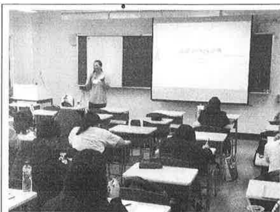
活 動 照 片 說 明