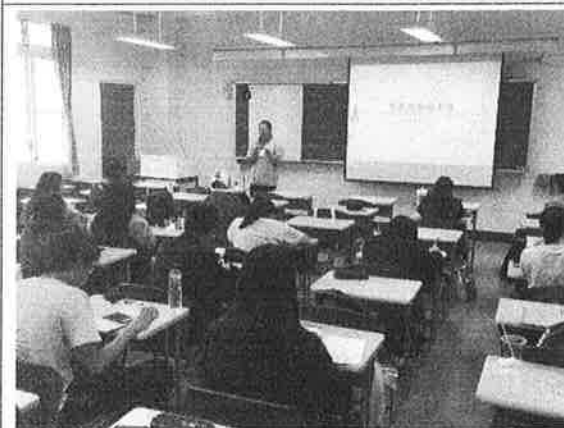
活 動 照 片 說 明