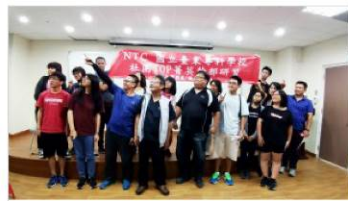
課外活動組06/13(三)社團TOP菁英品德教育講座花絮 2018-06-14 10:56