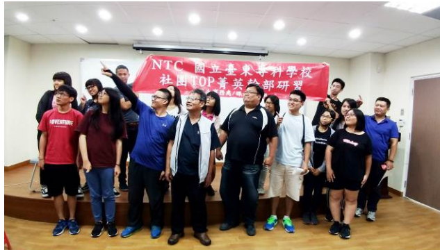
講師與學生社團幹部合影