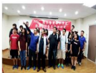
課外活動組06/13(三)社團 TOP菁英品德教育講座花絮 講 座活動內容花絮： 本次研習

http://std.ntc.edu.tw/p/loy/activity_detail.asp?id=23332&ClassID=606&page=1&lastpage=10