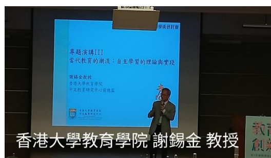
香港大學謝錫金教授