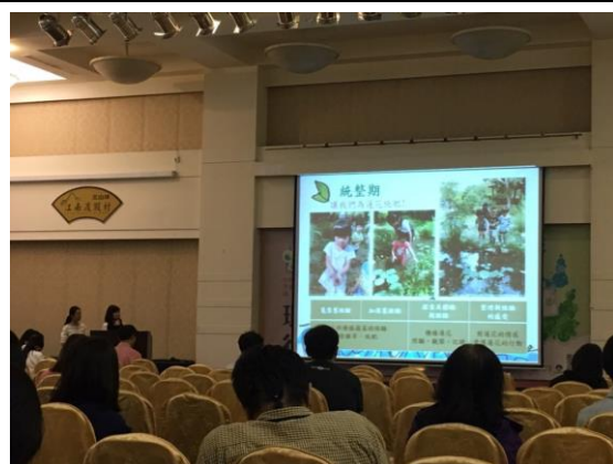
學術暨實務交流國際研討會現場