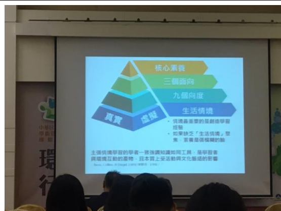
學術暨實務交流國際研討會現場