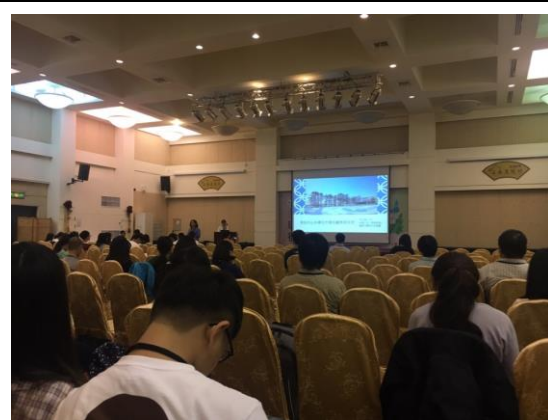
學術暨實務交流國際研討會現場