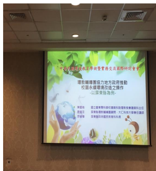
學術暨實務交流國際研討會現場