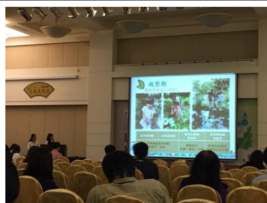
學術暨實務交流國際研討會現場