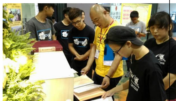
評審委員查看資料及提問(一)