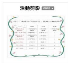
106-2 東專合作教育盃籃球比賽-(1) 更多精彩照片，詳見網址: 臺東專校數位媒體雲 - 活動演講網