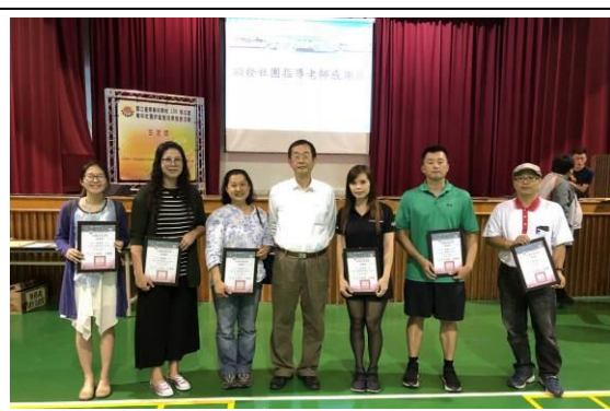
校長與社團指導老師合影