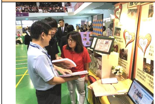
評審委員查看資料及提問(三)