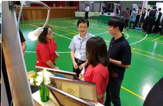
評審委員查看資料及提問(二)