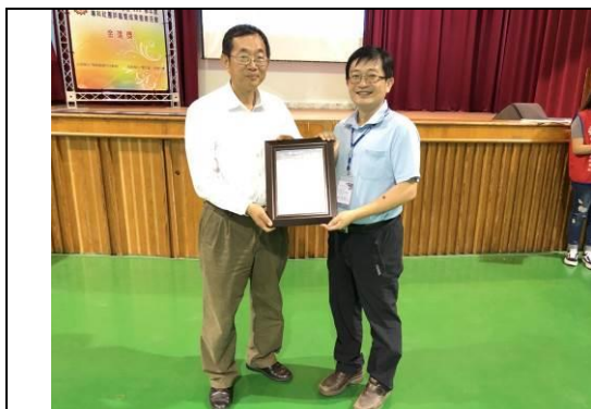
校長頒發評審委員感謝狀