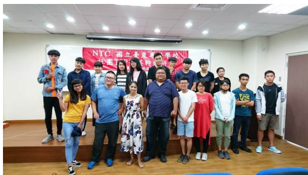
講師與學生社團幹部合影