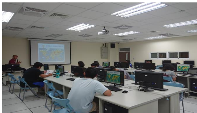
放逐遠漂 - 歐美啪啪造