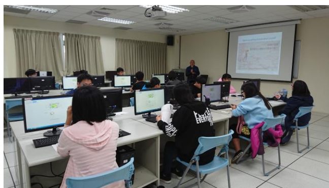
悠閒啟程 - 亞洲輕旅行