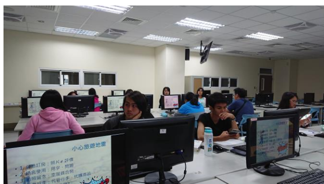
悠閒啟程 - 亞洲輕旅行