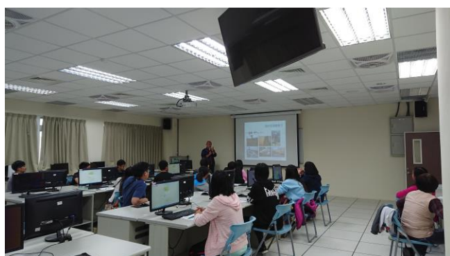
悠閒啟程 - 亞洲輕旅行