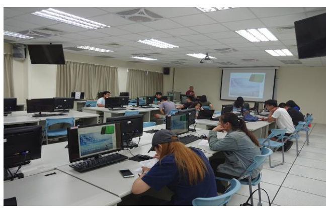
放逐遠漂 - 歐美啪啪造