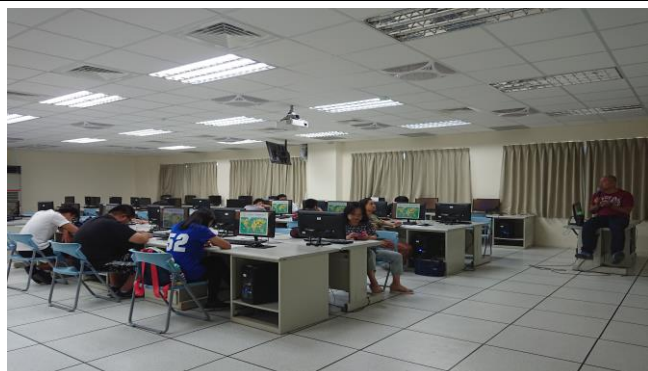
放逐遠漂 - 歐美啪啪造