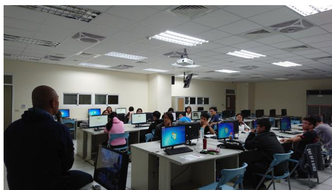
悠閒啟程 - 亞洲輕旅行