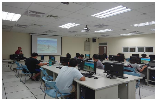
放逐遠漂 - 歐美啪啪造