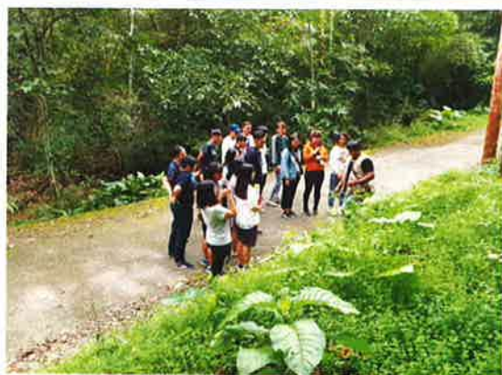
認識傳統植物文化(一)