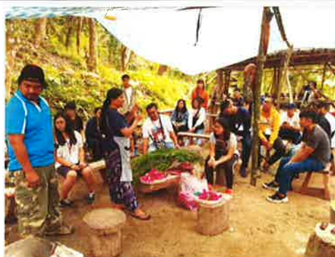
介紹魯凱族頭飾文化