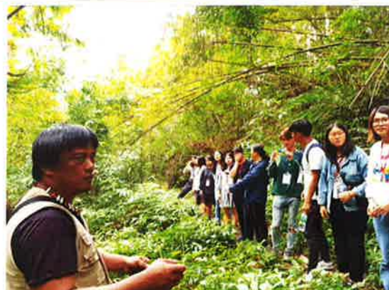
認識傳統植物文化(二)