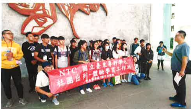
出發前活動及安全規範說明