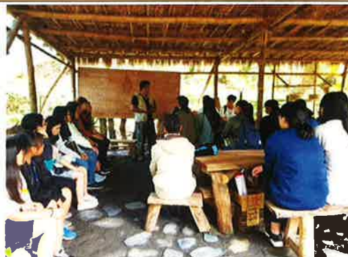
山林智慧學習與分享(二)