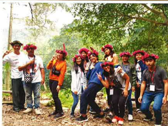
頭飾編織成品展現