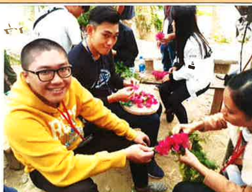
頭飾編織/自然素材