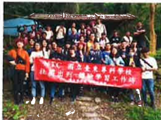
圖文 / 課外活動組