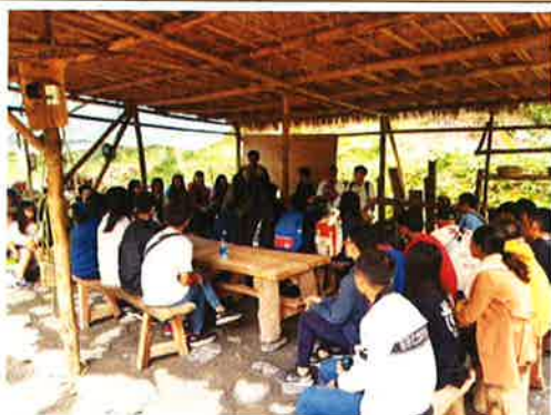
山林智慧學習與分享(一)