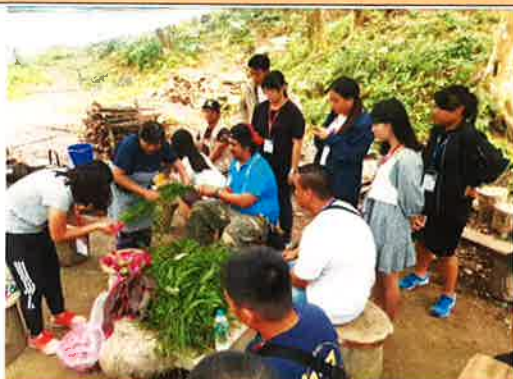
頭飾編織/自然素材