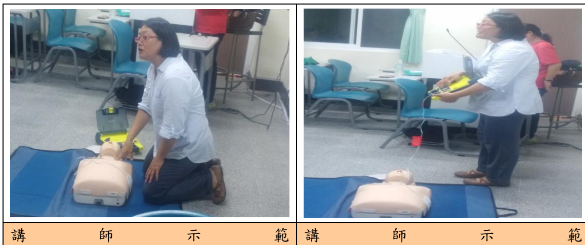
講 師 示 範