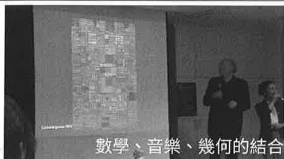
數學、音樂、幾何的結合