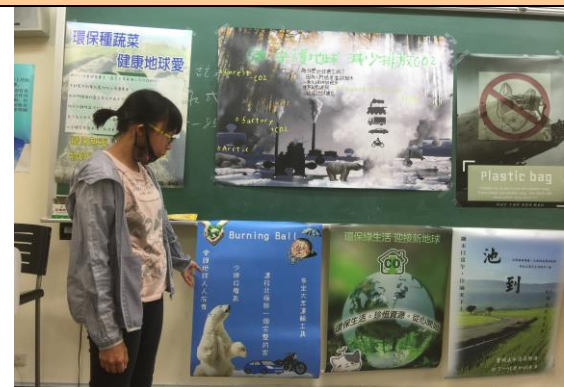
學生海報呈現與報告(五)