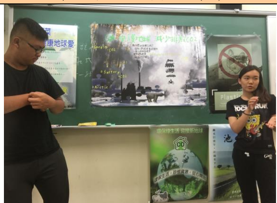
學生海報呈現與報告(三)