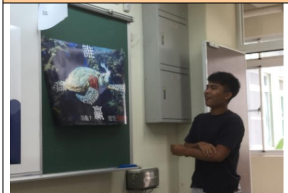
學生海報呈現與報告(四)