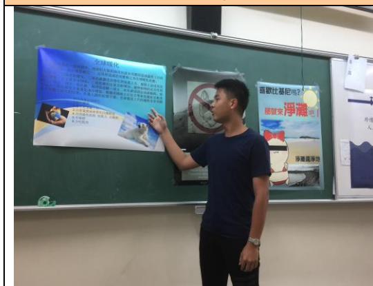
學生海報呈現與報告(二)