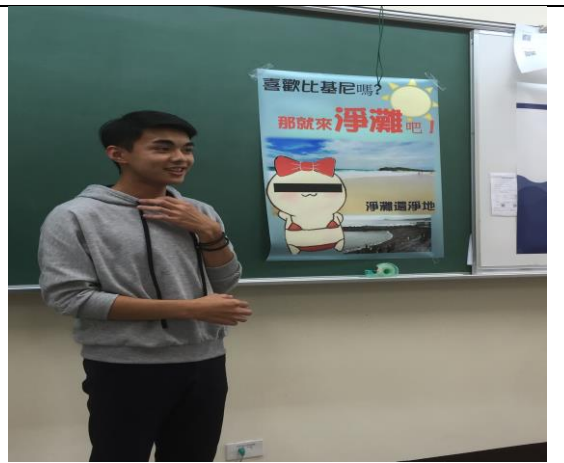
學生海報呈現與報告(一)