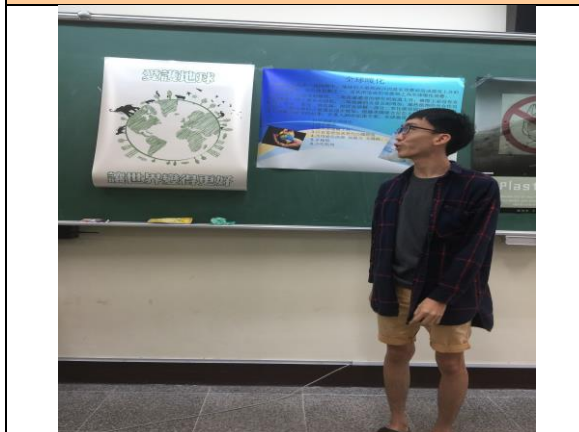
學生海報呈現與報告(六)