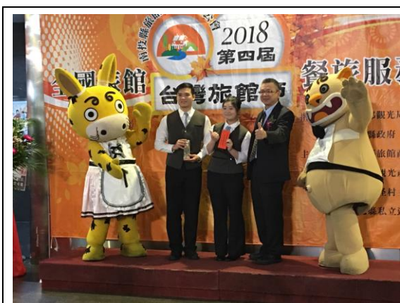
大專學院組獲得托盤冠軍頒獎