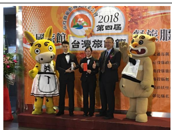
大專學院組獲得房務整床冠軍