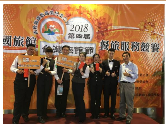
隊長與選手賽後慶祝