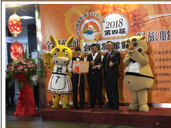
高中、職組獲得房務整床第三名頒獎