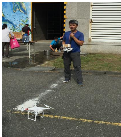
空拍機的操作使用解說