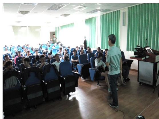
講師與學員互動照片