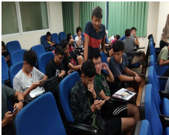
手機拍攝操作指導(二)