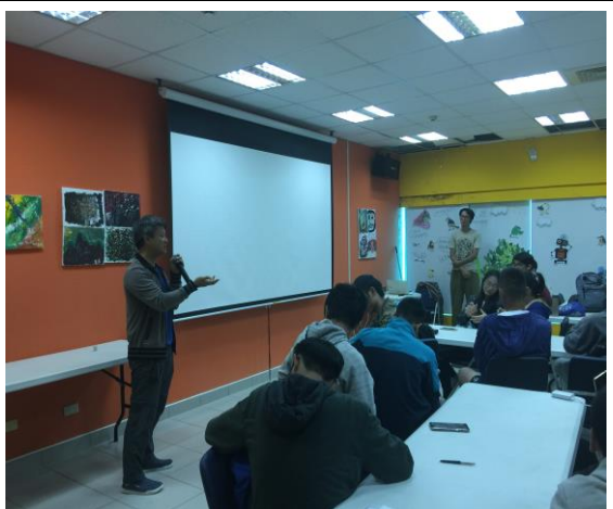
室外實拍前講解(環教中心教室)