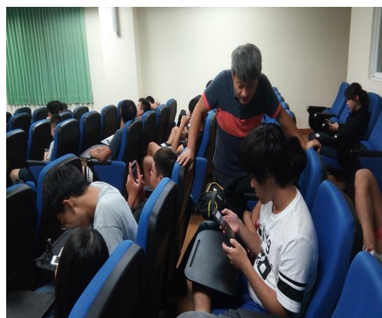
手機拍攝操作指導(一)