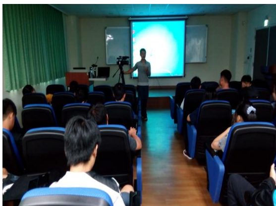
攝影器材使用教學