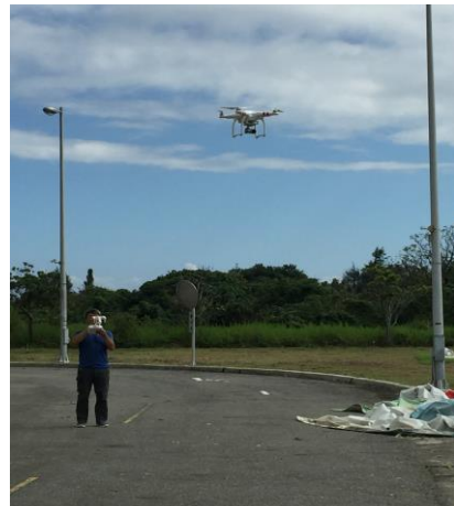
空拍機的實拍解說