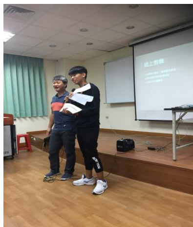
室內上課(學生解說)