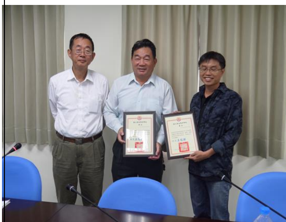
教師評鑑優良教師獎勵狀頒獎 (合照)