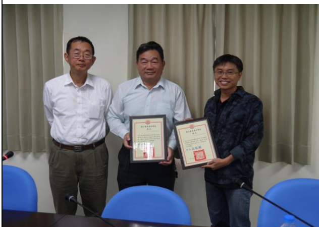
教師評鑑優良教師獎勵狀頒獎 (合照)