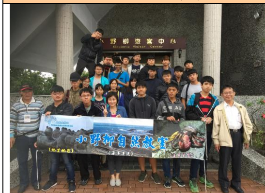
全體學員活動合照 (一)