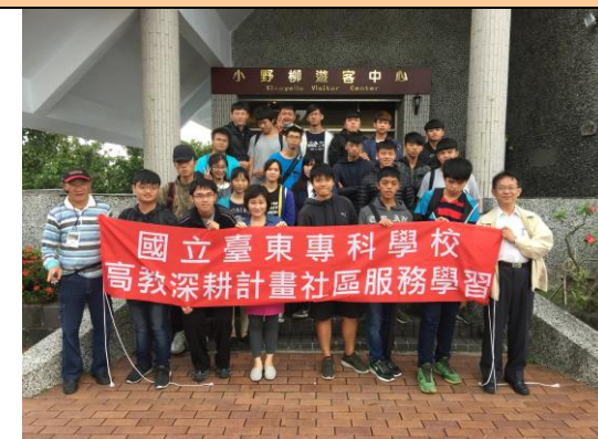
全體學員活動合照 (二)