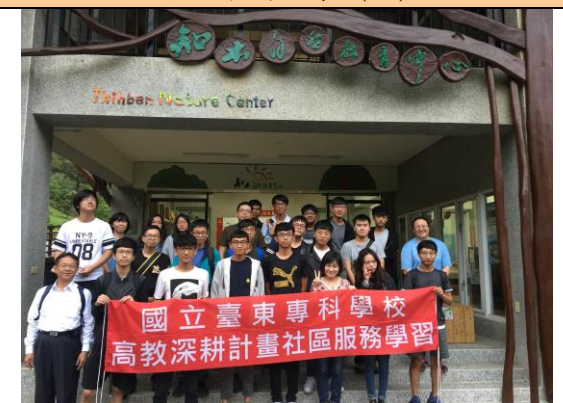
全體學員活動合照