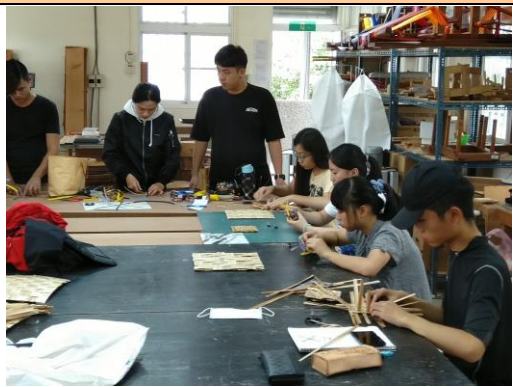
地方特色工藝參加學生實作體驗情形