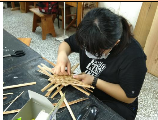
參加學生實作體驗情形