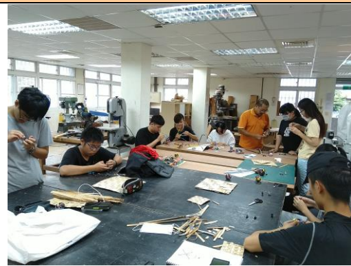
地方特色工藝參加學生實作體驗情形