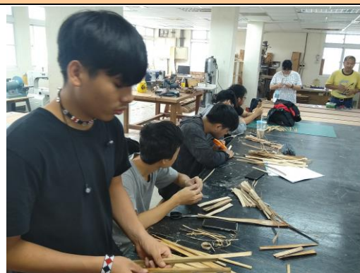
地方特色工藝參加學生實作體驗情形