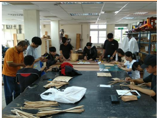
參加學生實作體驗情形