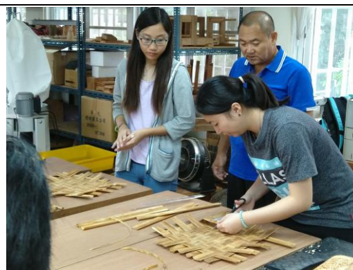
地方特色工藝活動辦理情形