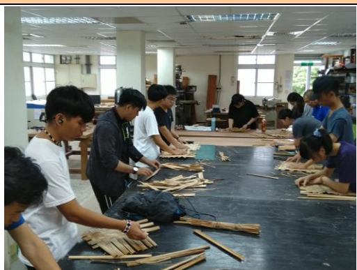
地方特色工藝參加學生實作體驗情形