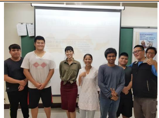
講座後與參與同學合照