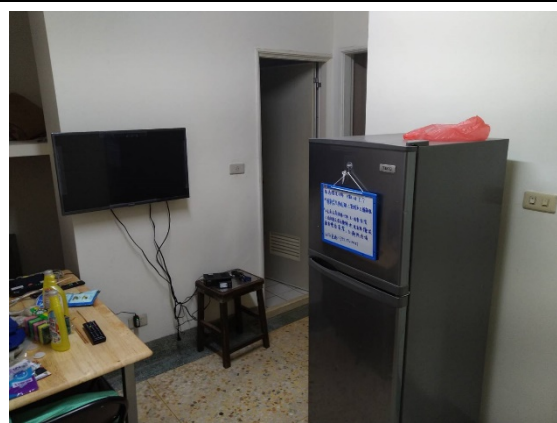
中源機電學生住宿環境