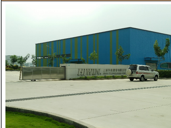
大雅電氣訪視(上銀科技)