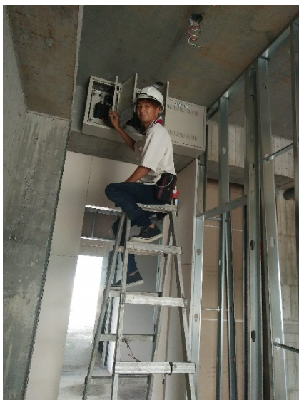
東一水電工程行訪視