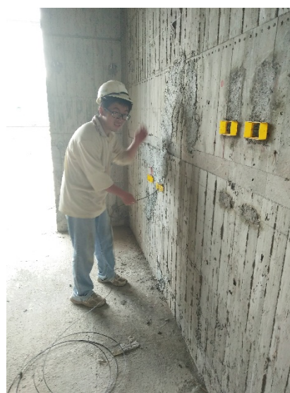
東一水電工程行訪視