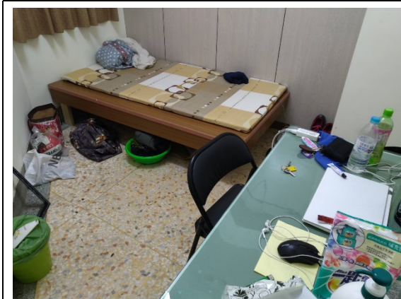
中源機電學生住宿環境