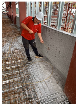
大雅電氣學生工作情形