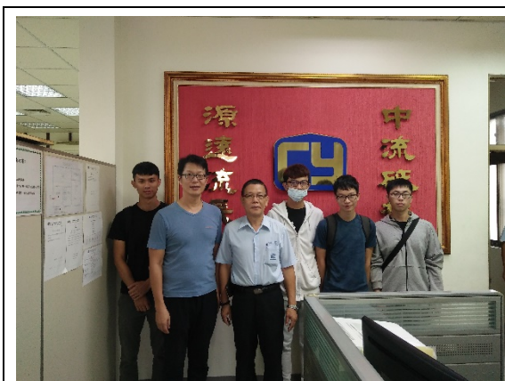
中 源 機 電 訪 視