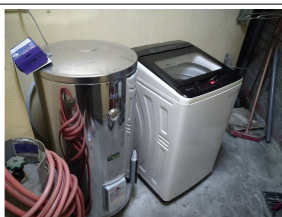
中源機電學生住宿環境