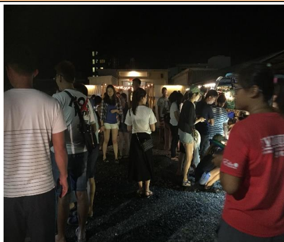
綠島公館社區人文踏查體驗照片