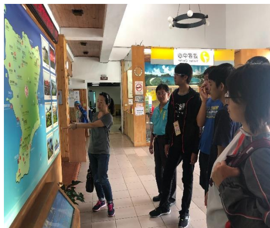
東部海岸國家風景區綠島遊客中心環境生態解說照片(二)