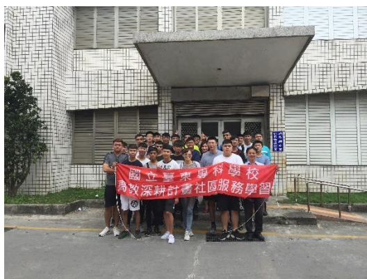
綠島南寮社區人文踏查體驗照片