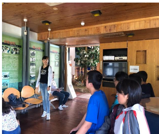
東部海岸國家風景區綠島遊客中心環境生態解說照片(一)