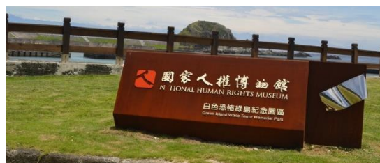
國家人權博物館人文踏查體驗照片