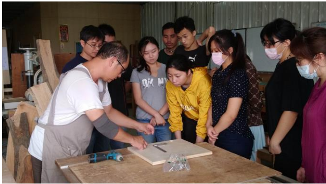
圖 7、6 月 16 日上課情況