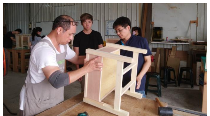
圖 12、6 月 16 日上課情況