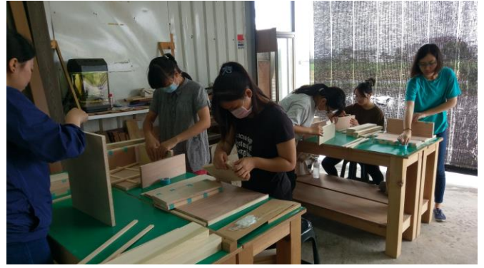
圖 6、6 月 15 日上課情況