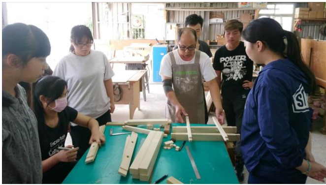
圖 5、6 月 15 日上課情況