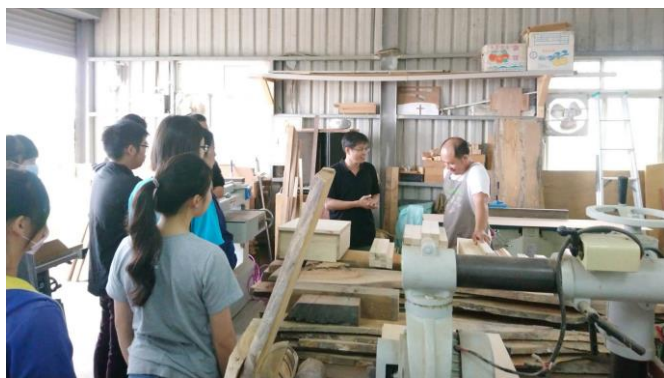
圖 1、6 月 15 日上課情況