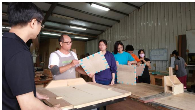
圖 3、6 月 15 日上課情況