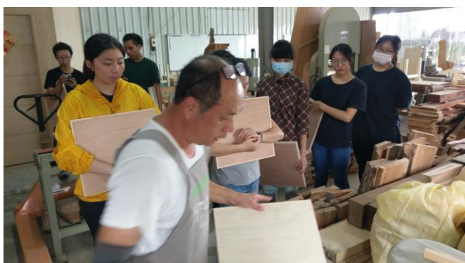
圖 11、6 月 16 日上課情況