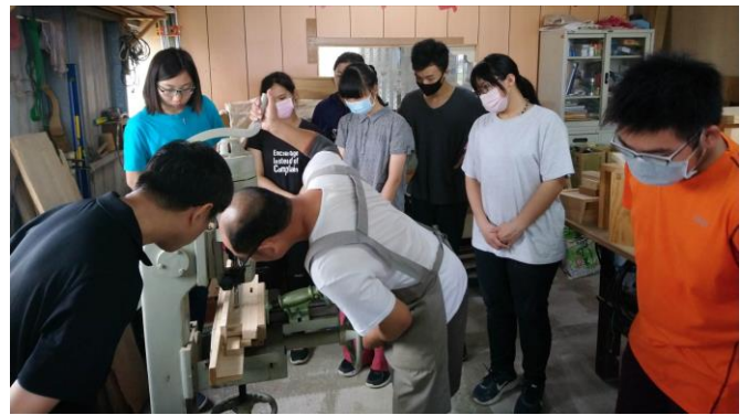
圖 4、6 月 15 日上課情況