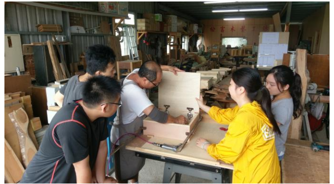
圖 8、6 月 16 日上課情況