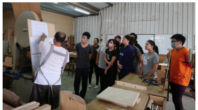
圖 2、6 月 15 日上課情況