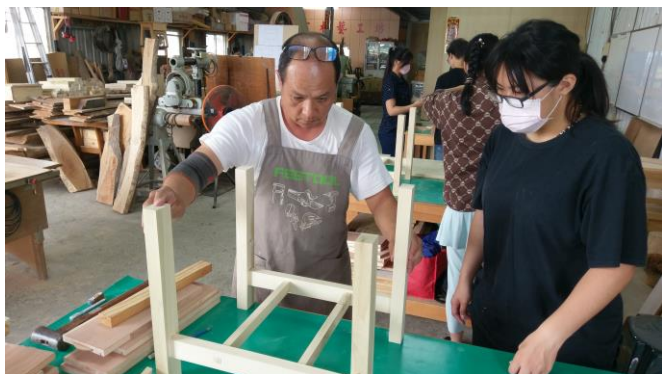
圖 9、6 月 16 日上課情況