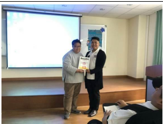
演 講 實 況