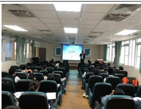
演 講 實 況