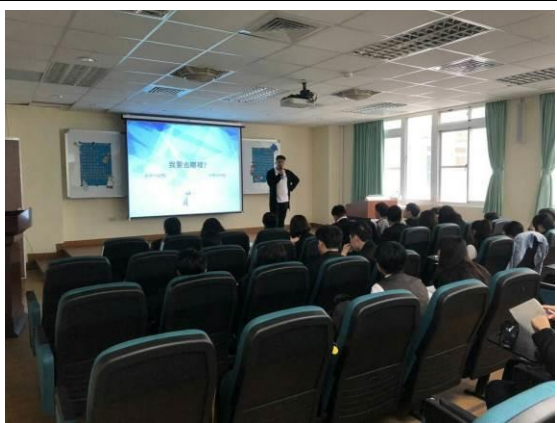
演 講 實 況