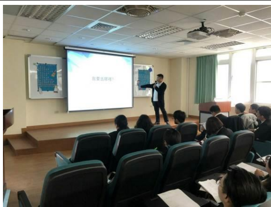
演 講 實 況