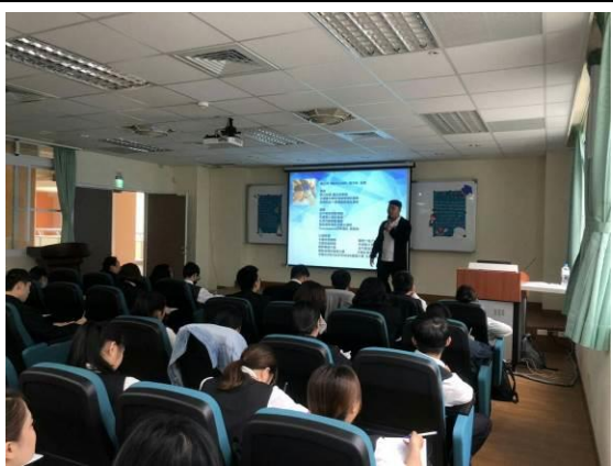
演 講 實 況