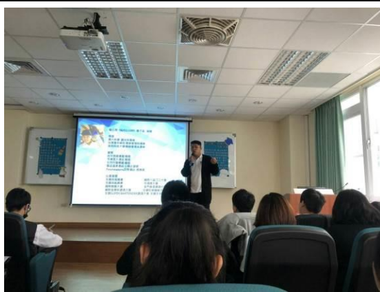
演 講 實 況