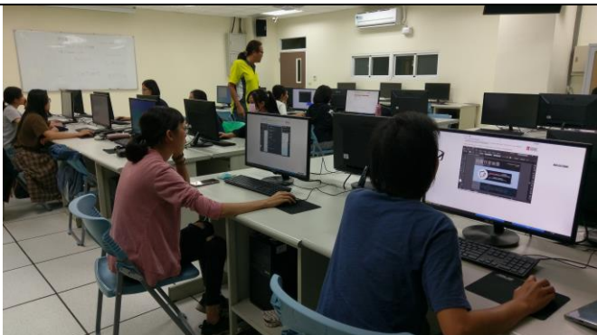
圖 9、Adobe Illustrator 證照檢定