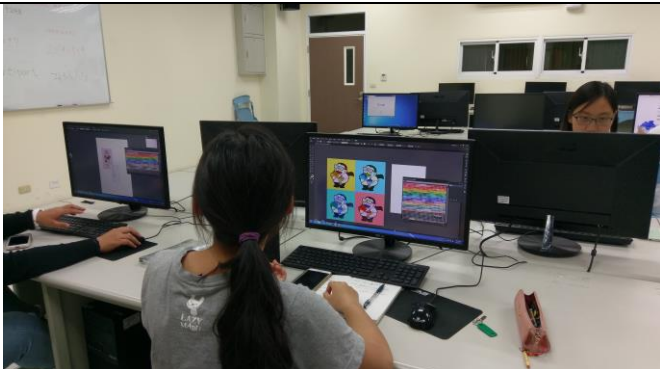
圖 7、Adobe Illustrator 軟體教學案例介紹