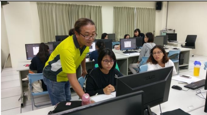
圖 5、考前重點整理輔導及講解考證流程