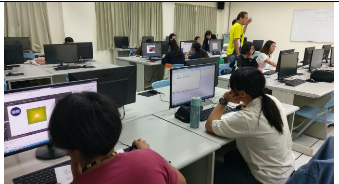
圖 6、考前重點整理輔導及講解考證流程