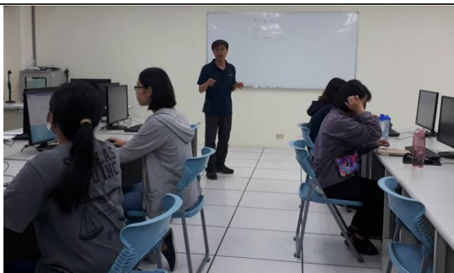
圖 1、軟體的簡介與基本功能講解