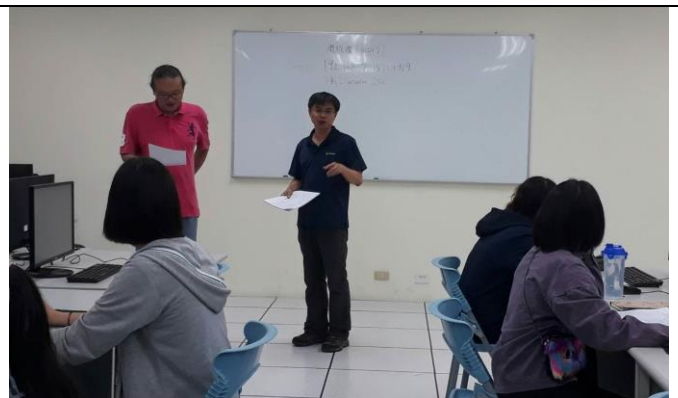
圖 2、軟體的簡介與基本功能講解、個別軟體操作輔導