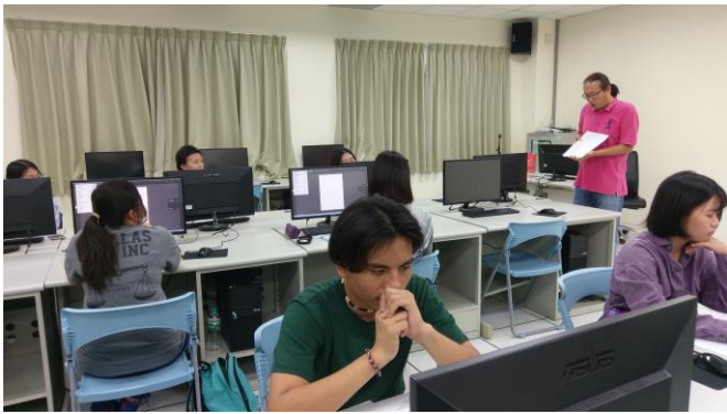
圖 3、軟體的簡介與基本功能講解、個別軟體操作輔導