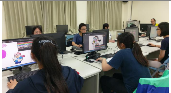
圖 8、Adobe Illustrator 軟體教學案例介紹