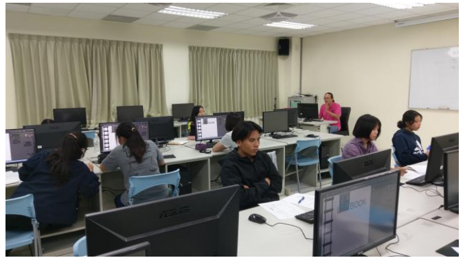
圖 4、軟體的簡介與基本功能講解、個別軟體操作輔導