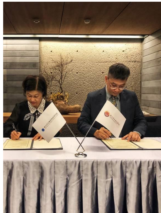
與陶瓷博物館館長簽定 MOU