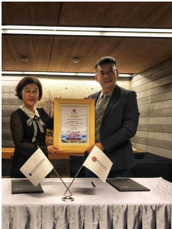
校 方 端 致 贈 感 謝 狀