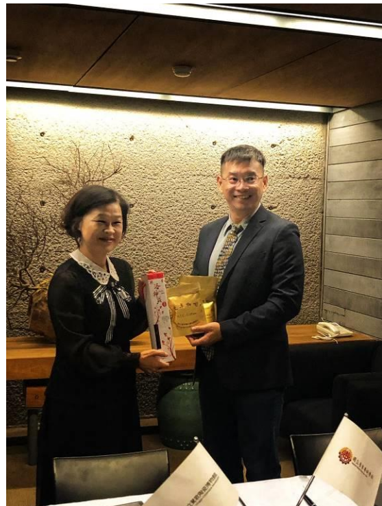
校 方 回 贈 伴 手 禮