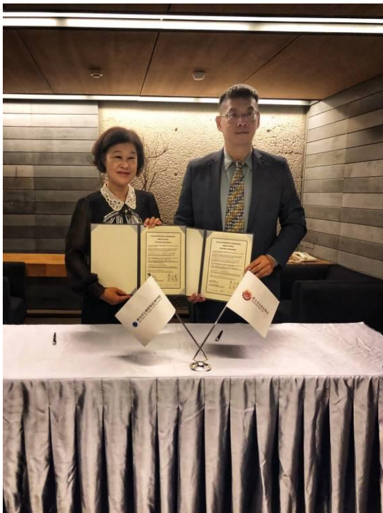
合 作 備 忘 錄 簽 訂