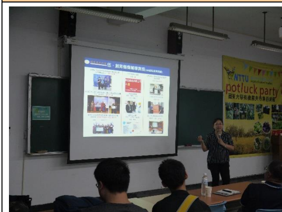
楊經理講解如何創業及案例