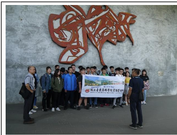
主任出發前行程說及注意事項要求