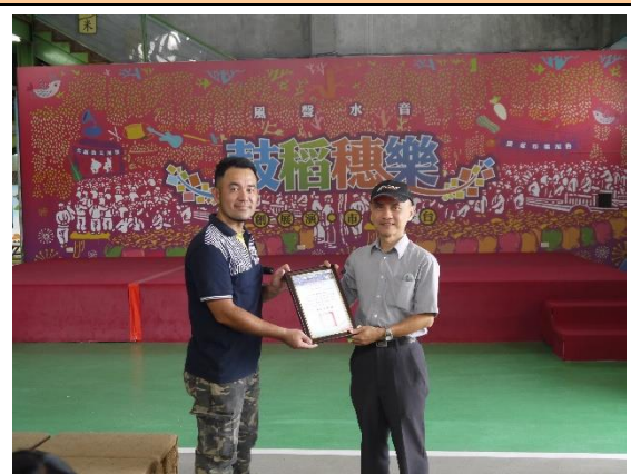
關山農會操作前講解並頒贈感謝狀