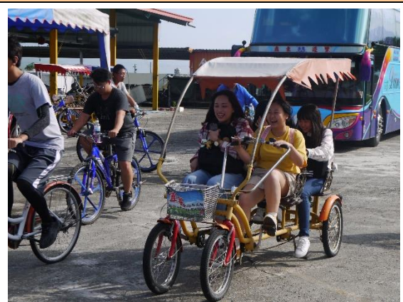
出發了！大家一起努力往前