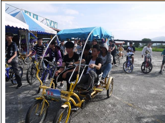
單車體驗鍛鍊體力