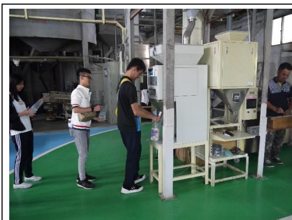
動手裝米感受收成樂趣