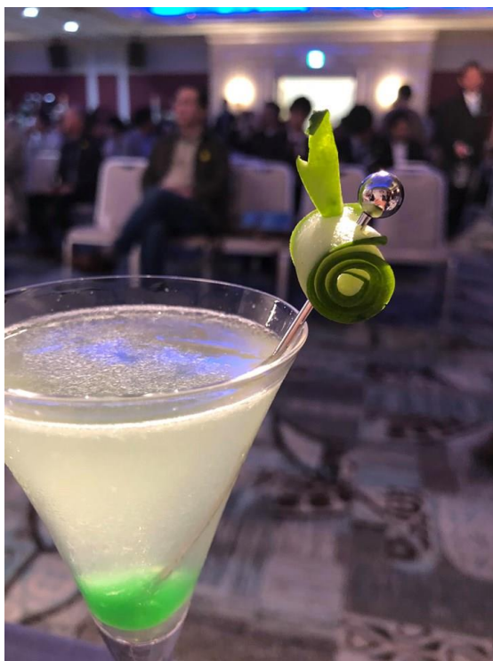
活 動 照 片 說 明