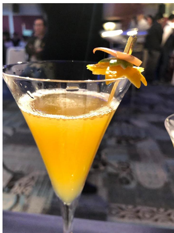
活 動 照 片 說 明