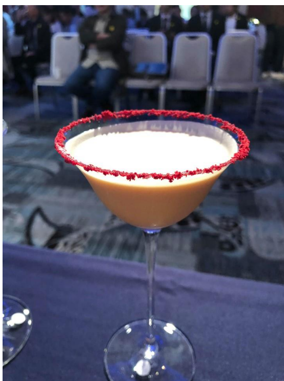
活 動 照 片 說 明