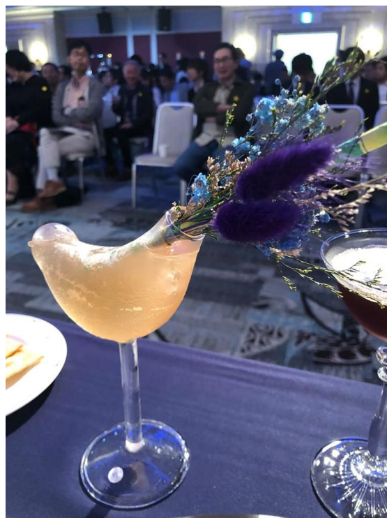
活 動 照 片 說 明