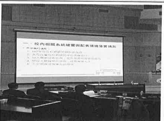
專 題 演 講 ( 4 )