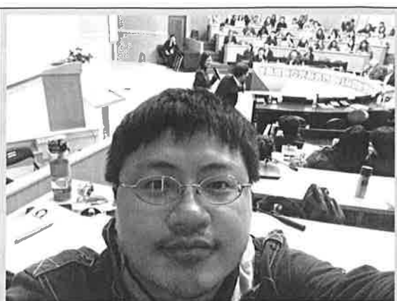
與 會 人 員 合 影 ( 2 )