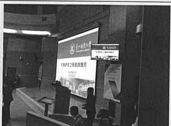
專 題 演 講 ( 2 )