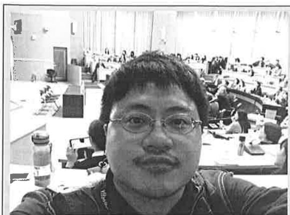
與 會 人 員 合 影 ( 1 )