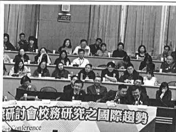
大 會 開 幕 典 禮