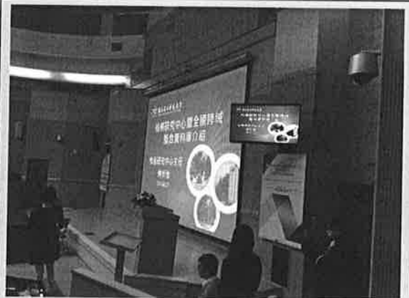
專 題 演 講 ( 1 )