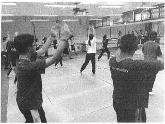
活 動 照 片 說 明