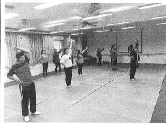
活 動 照 片 說 明