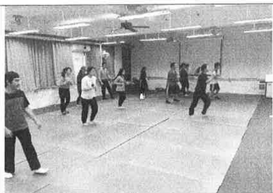
活 動 照 片 說 明