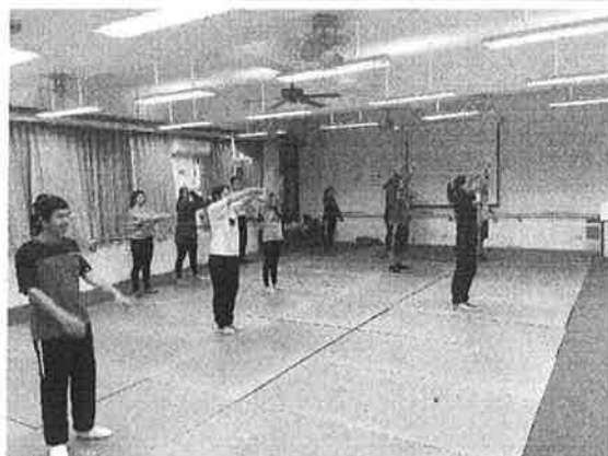
活 動 照 片 說 明