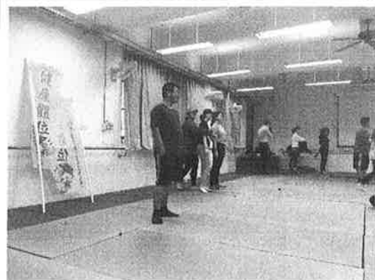
活 動 照 片 說 明