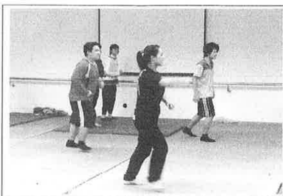
活 動 照 片 說 明