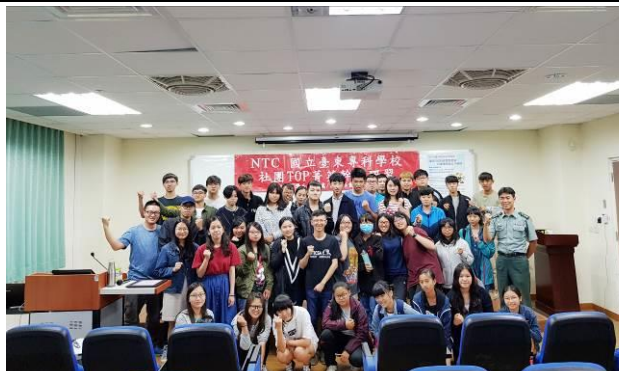
講師與學生社團幹部合影