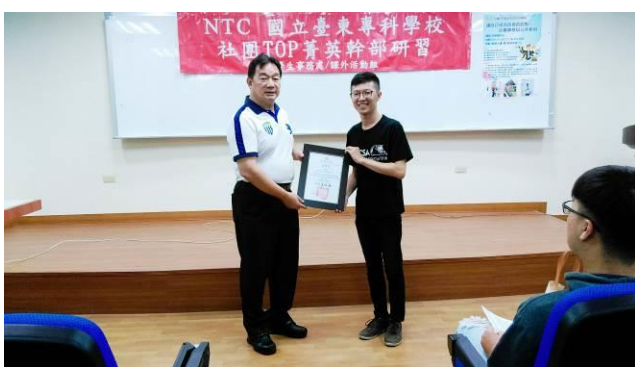
洪學務主任致贈講師感謝狀