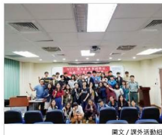
圖文 / 課外活動組