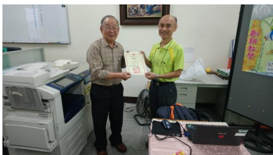
創新教學講座 - 柳賢教授