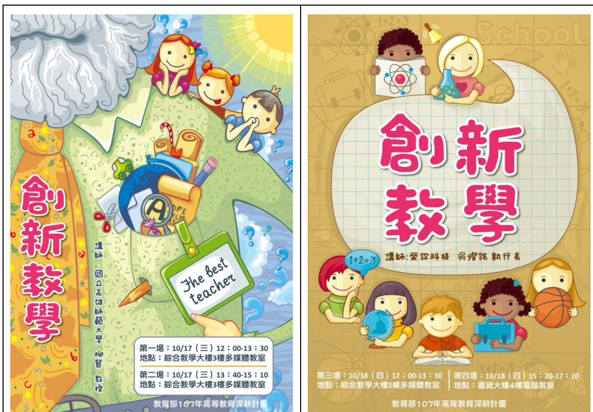
創 新 教 學 講 座 海 報