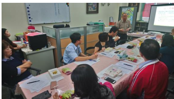
創新教學講座 - 柳賢教授