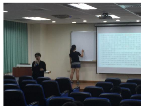
講師與學生授課互動剪影