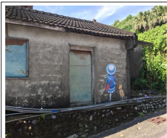
比西里岸原始部落彩繪擷取圖照