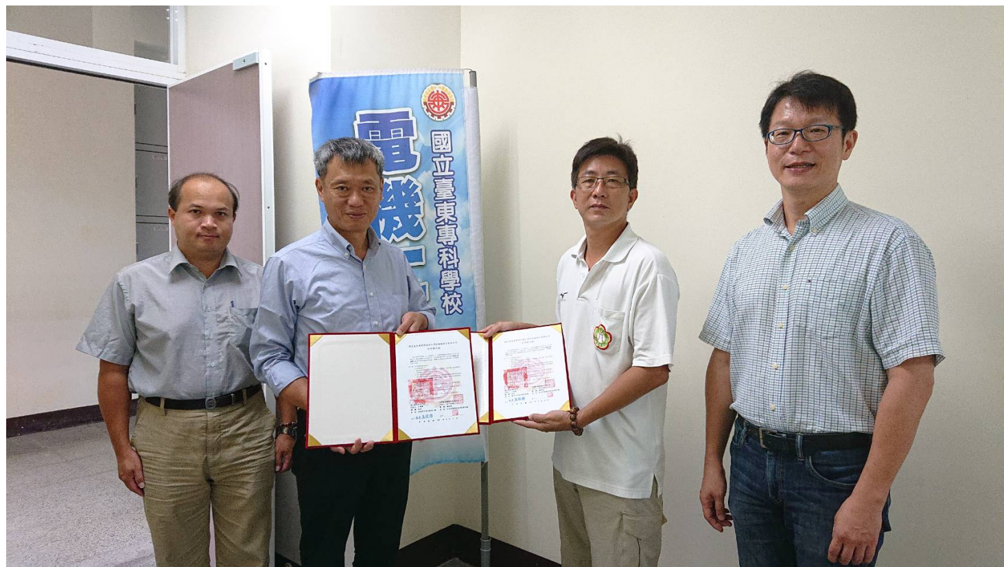
與 產 業 合 作 夥 伴 代 表 簽 訂 合 作 備 忘 錄 合 影