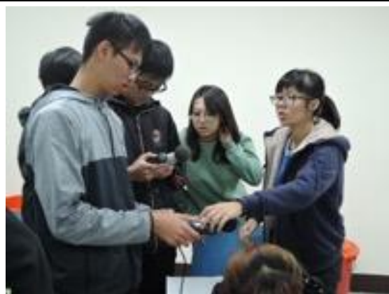
熱帶綠建築實務課程教學活動現場