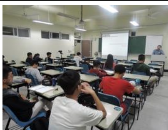
熱帶綠建築實務課程教學活動現場