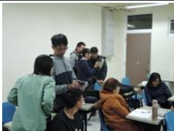
熱帶綠建築實務課程教學活動現場