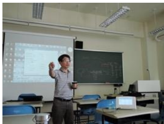
熱帶綠建築實務課程教學活動現場