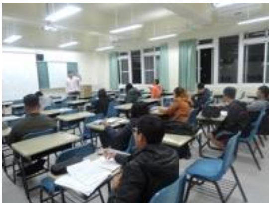
熱帶綠建築實務課程教學活動現場