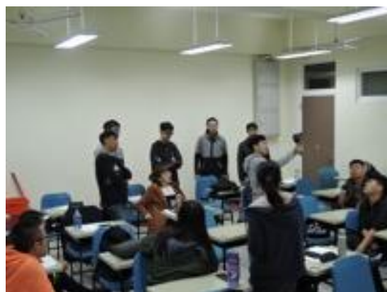
熱帶綠建築實務課程教學活動現場