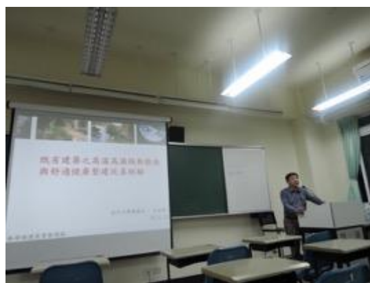
熱帶綠建築實務課程教學活動現場