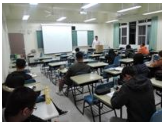
熱帶綠建築實務課程教學活動現場