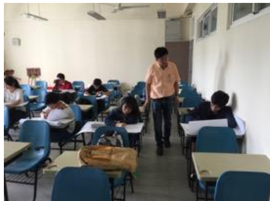
熱帶綠建築實務課程教學活動現場