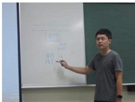
熱帶綠建築實務課程教學活動現場