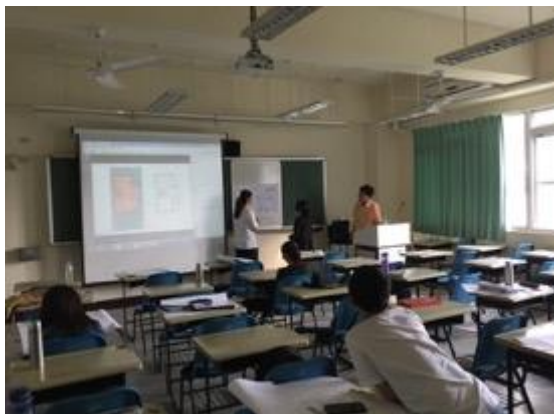
熱帶綠建築實務課程教學活動現場