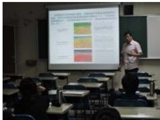
熱帶綠建築實務課程教學活動現場