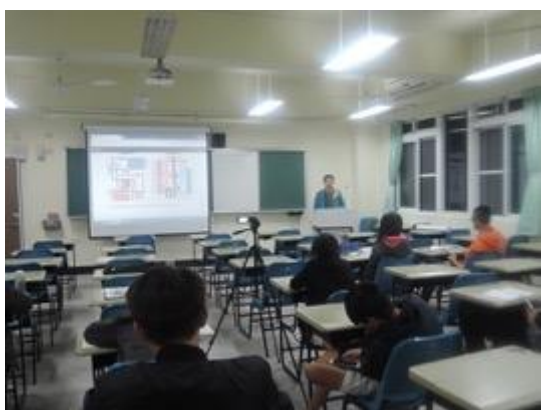
熱帶綠建築實務課程教學活動現場