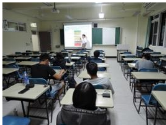
熱帶綠建築實務課程教學活動現場