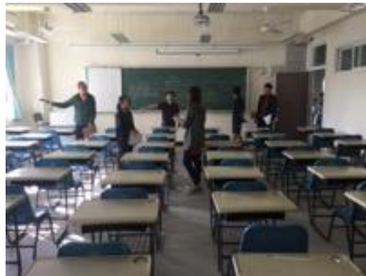
熱帶綠建築實務課程教學活動現場