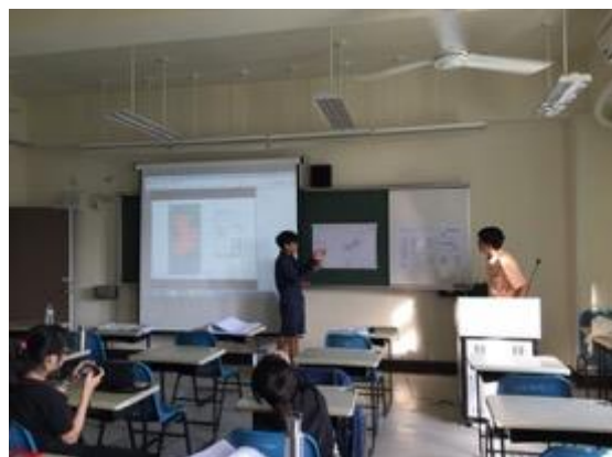
熱帶綠建築實務課程教學活動現場場