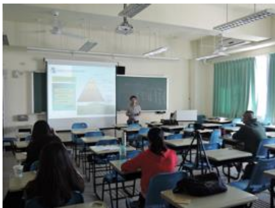
熱帶綠建築實務課程教學活動現場