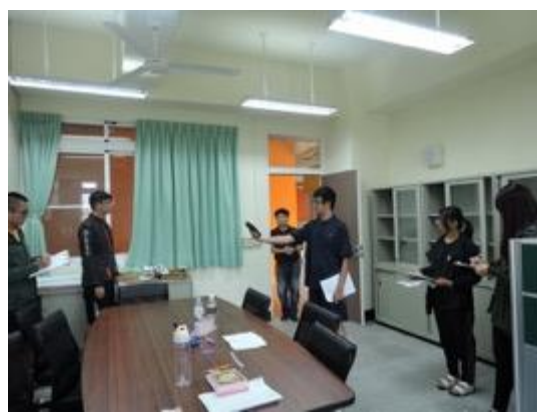
熱帶綠建築實務課程教學活動現場