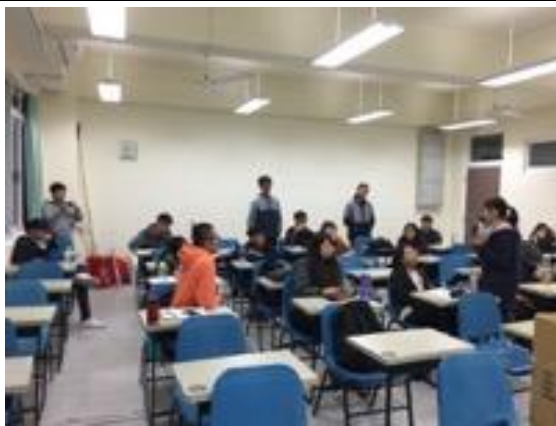
熱帶綠建築實務課程教學活動現場