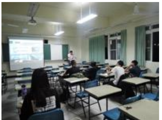
熱帶綠建築實務課程教學活動現場