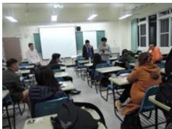
熱帶綠建築實務課程教學活動現場