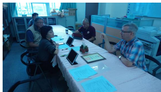
英文科教師社群講座上課情形 1