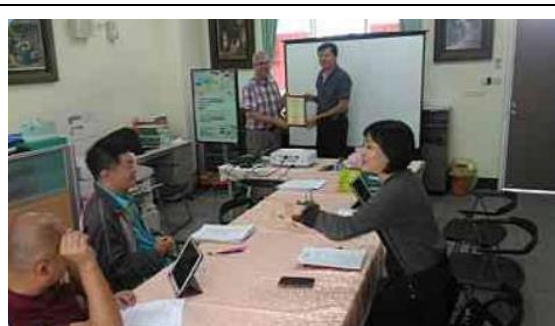
英文科教師社群講座上課情形 6