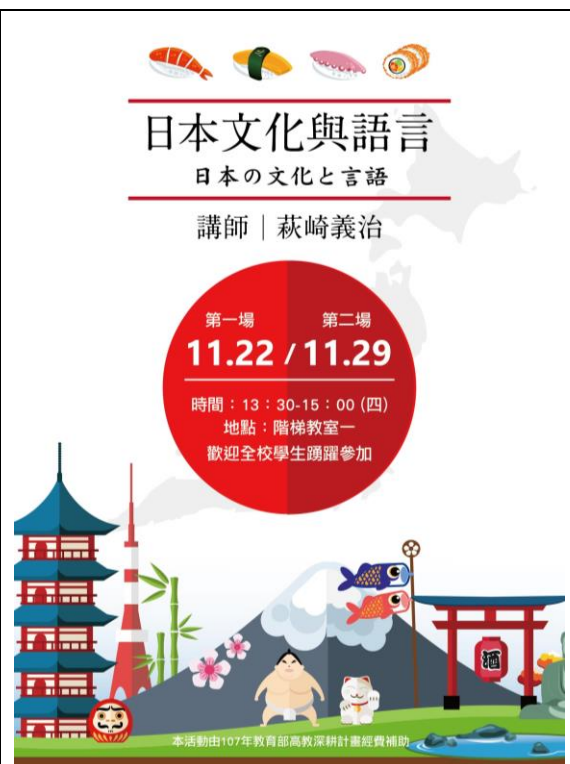
日 本 語 海 報