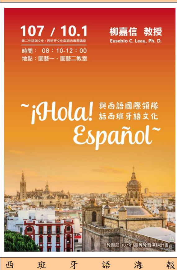
西 班 牙 語 海 報