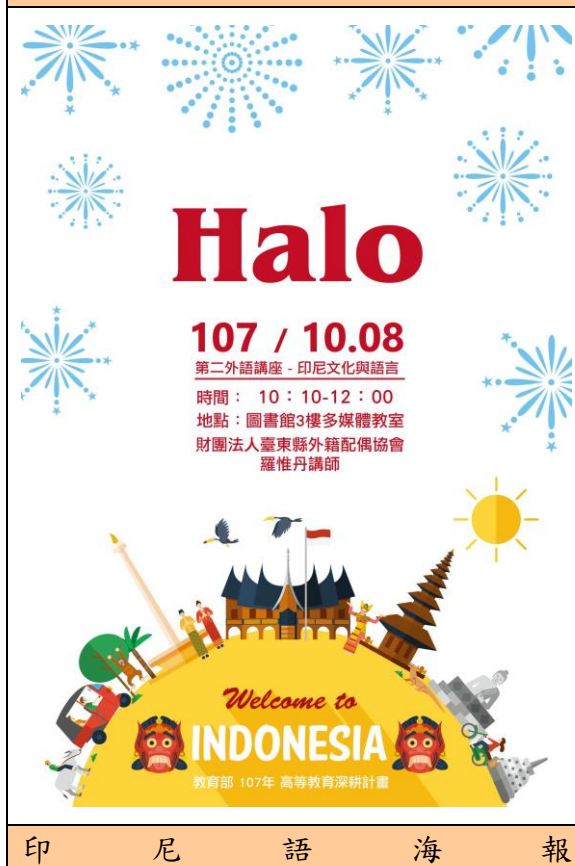
印 尼 語 海 報