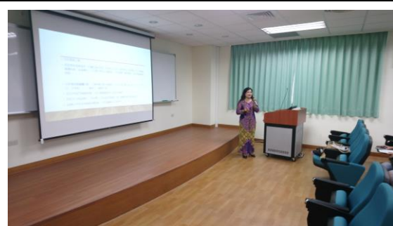
講座上課情形(印尼語)