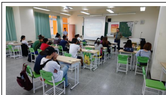
講座上課情形(西班牙語)