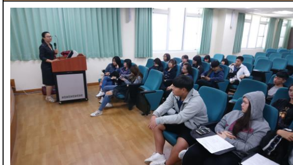
講座上課情形(泰語)