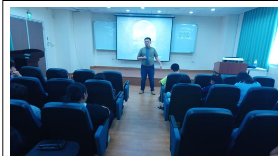
講座上課情形(西班牙語)