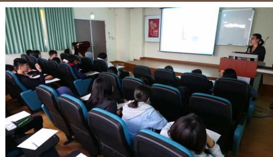
講座上課情形(泰語)