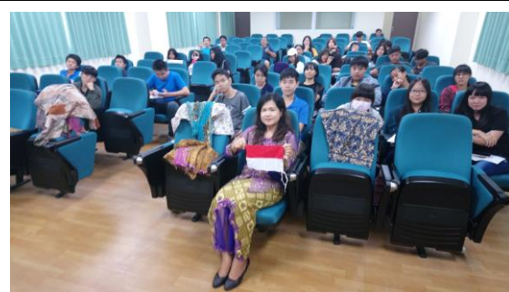
講座上課情形(印尼語)