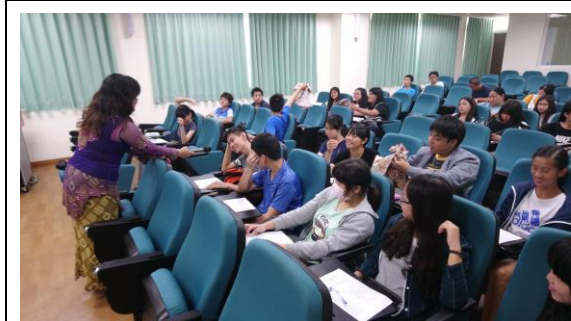
講座上課情形(印尼語)