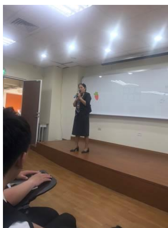
演 講 實 況