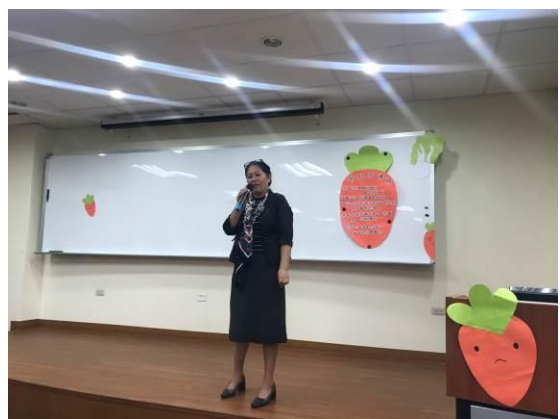
演 講 實 況