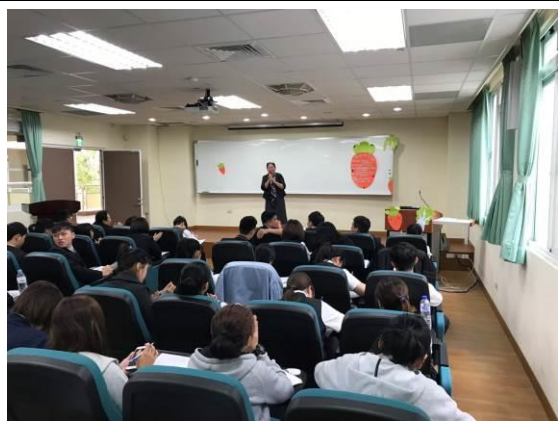
演 講 實 況