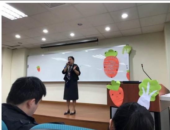
演 講 實 況