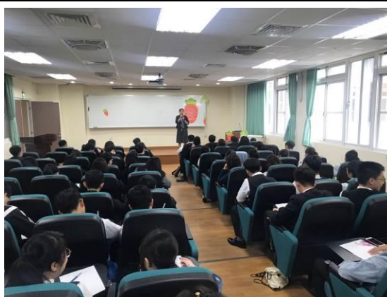
演 講 實 況