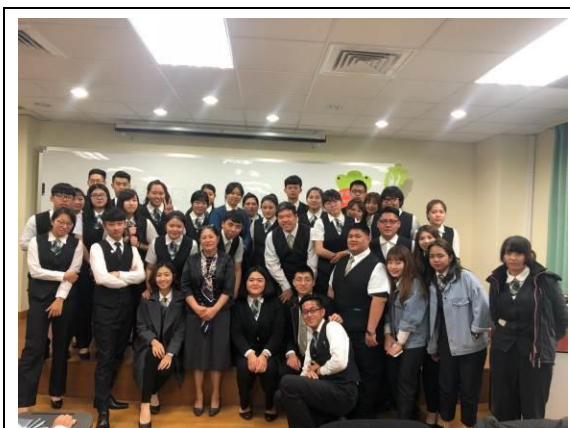
演 講 實 況