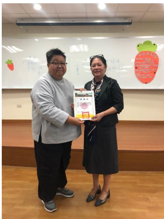
演 講 實 況