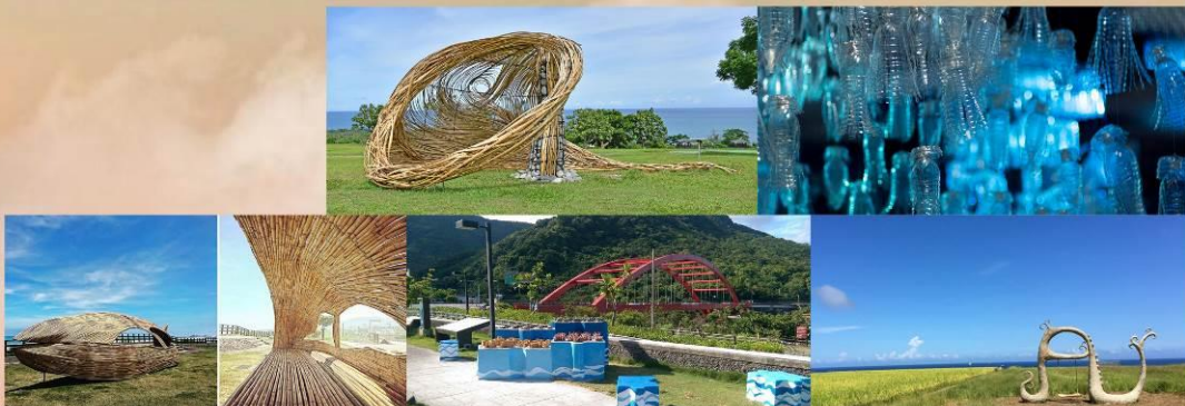
夜通識二 臺灣原住民藝術概論

東海岸人文藝術的特殊性，嘗試以原住民的美學觀尋找藝術創作的「傳統」與「現代」摺軌。由文化傳承、藝術型式、風格表現及文化脈絡等，體認族群內部審美觀，進而探索跨文化與跨島嶼間的藝術美感價值。